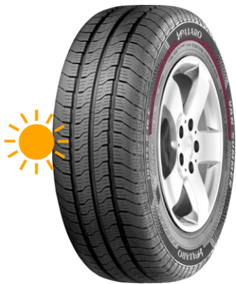
PAXARO VAN SUMMER