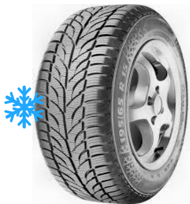
PAXARO WINTER PAXARO 4x4 WINTER