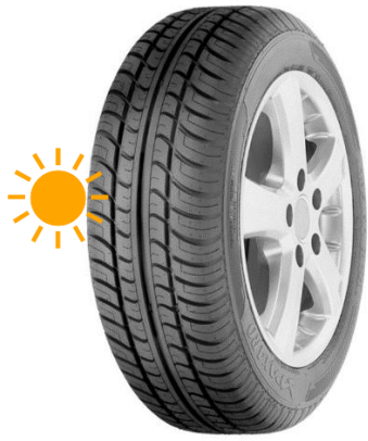
PAXARO SUMMER COMFORT