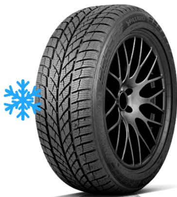
PAXARO INVERNO / SUV