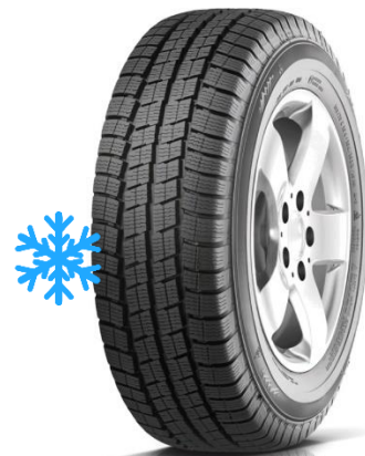
PAXARO VAN WINTER