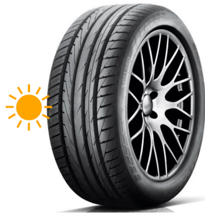
PAXARO RAPIDO / SUV